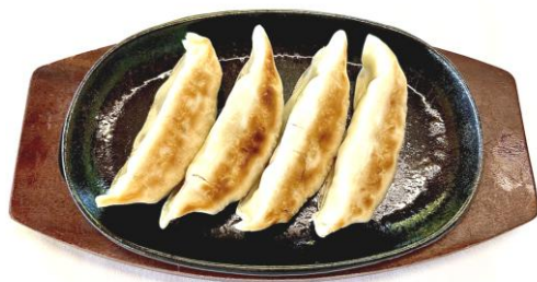
熱々鉄板ジャンボ餃子・・・700円