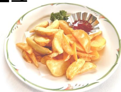
皮付きフライドポテト・・・550円