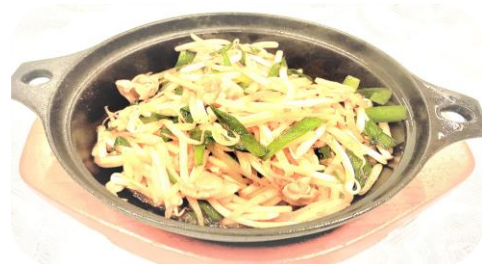
もやし炒め・・・700円