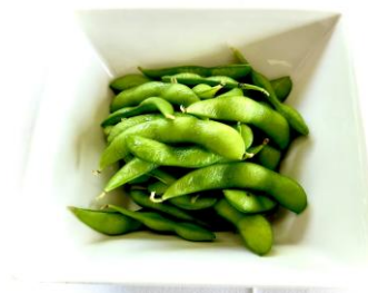
ビール定番 枝豆・・・400円