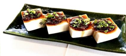
ピリ辛にらソースの冷奴・・・720円