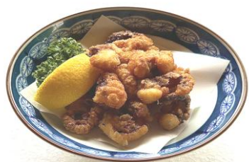
蛸のから揚げ・・・750円