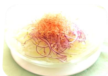
オニオンライスサラダ・・・600円