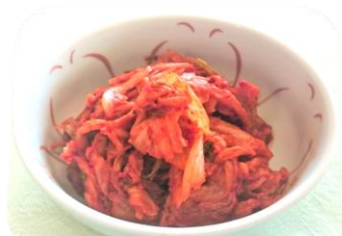
白菜キムチ・・・580円