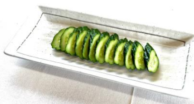
胡瓜の一本漬け・・・450円