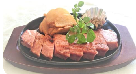
熱々 厚切りベーコンの鉄板焼き・・・870円